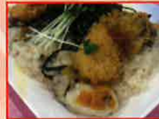
牡蠣師 あきつ丸 牡蠣の殻焼き等