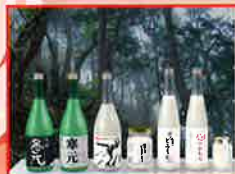
佐渡酒造(株) どぶろく