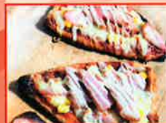
みちしおカフェ クロフッサンピザ