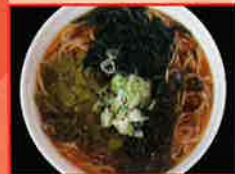
佐渡汽船(株) 海藻ラーメン