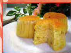
フチドール 島チーズ