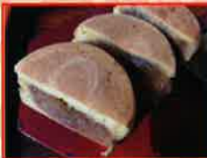
あんあん村 栗ごはん等