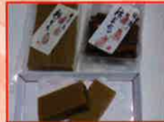
佐渡の村餅本舗 お餅