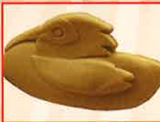
こいつちやキンちゃん本舗 朱鷺めき焼き