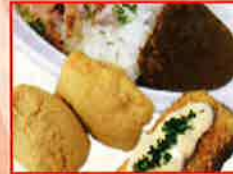
そばノスタの店 與左エ門 カレータ等