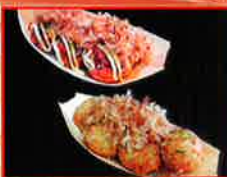
こなもん屋 纏 たご焼き