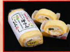
お菓子処 しまや いちご大福等