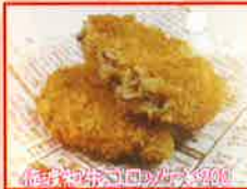
みくくす☆らいす 佐渡和牛コロッケ